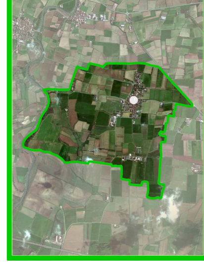
TAVOLA P5 SCALA 1:5.000

ENEL LINEE ELETTRICHE BASSA E MEDIA TENSIONE